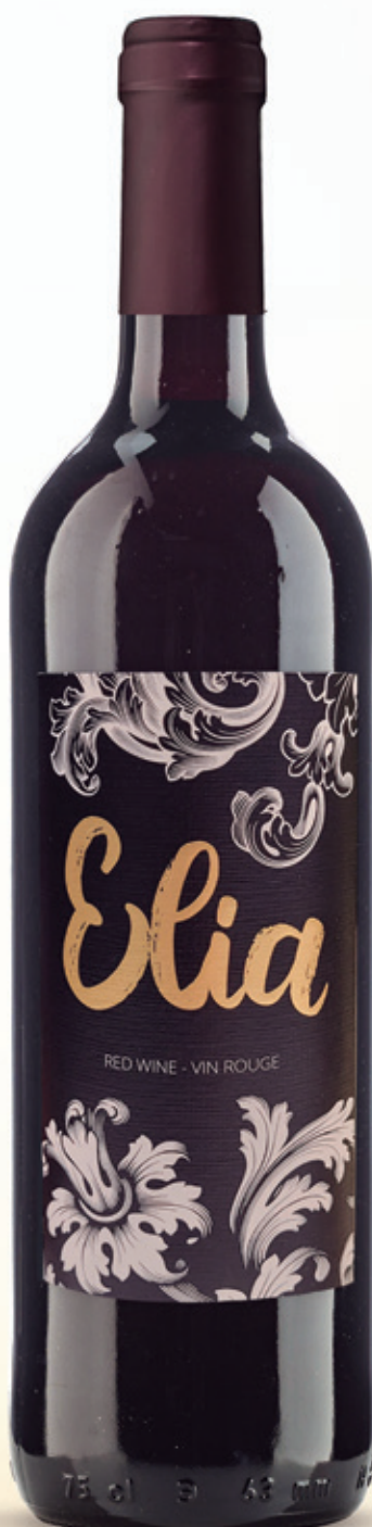
alc. 12 % vol.