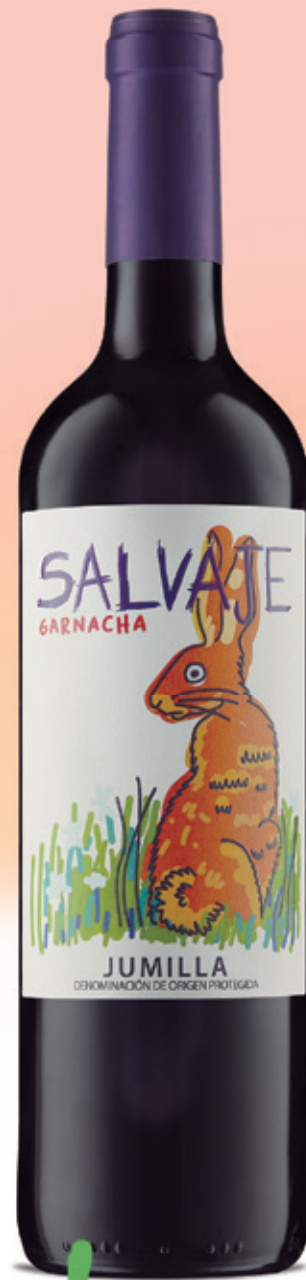
Garnacha alc. 13 % vol.