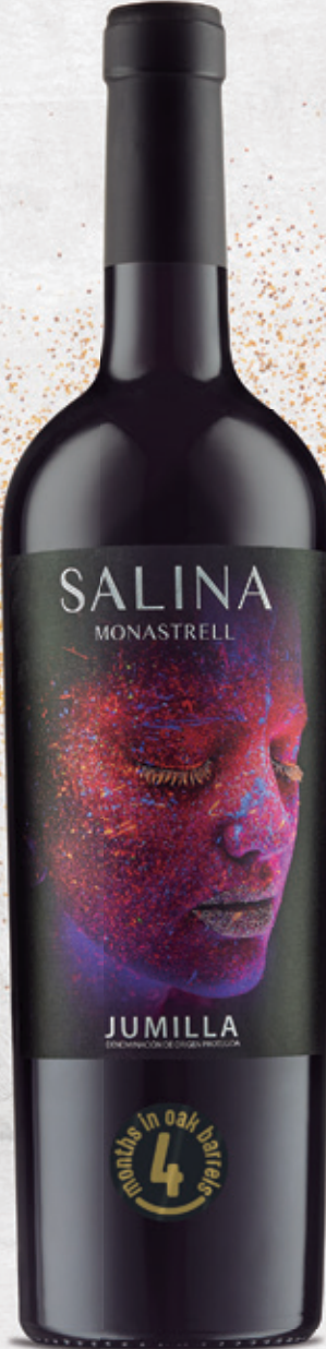
Chêne 4 mois Monastrell alc. 14 % vol.