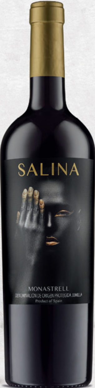
Monastrell alc. 13 % vol.