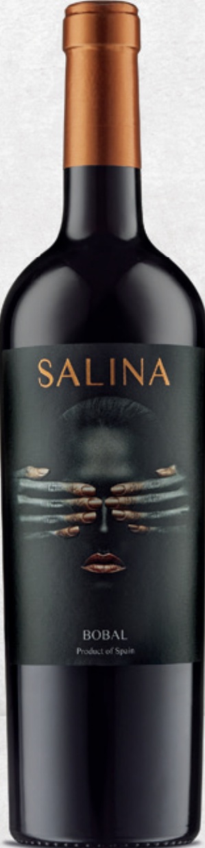
Bobal alc. 13,5 % vol.