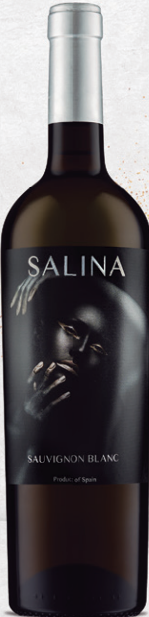
Sauvignon Blanc alc. 12 % vol.