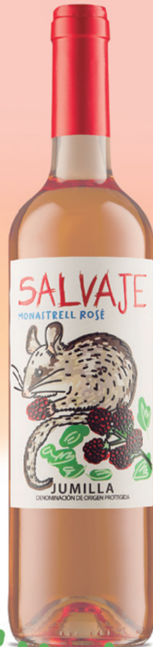
Monastrell rosé alc. 12,5 % vol.