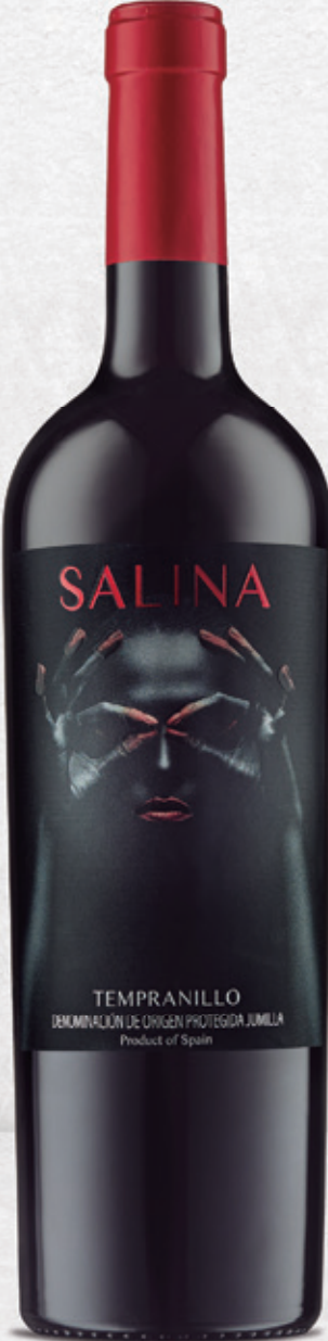
Tempranillo alc. 13 % vol.