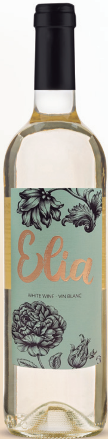
alc. 12 % vol.