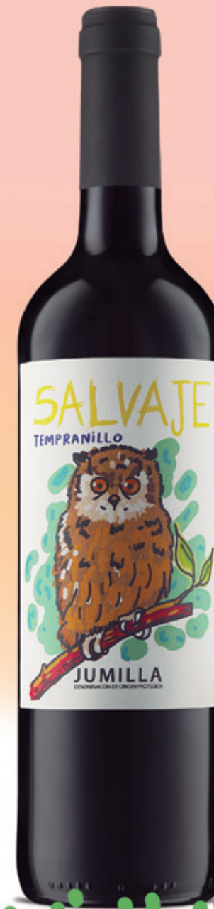
Tempranillo alc. 13 % vol.