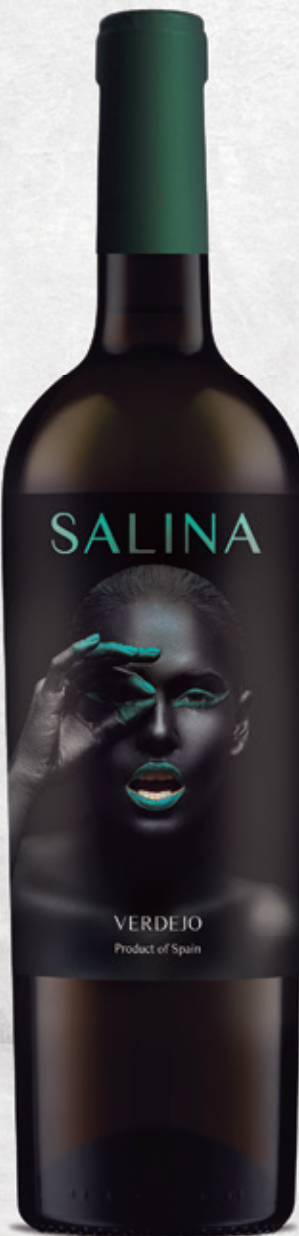
Verdejo alc. 12 % vol.