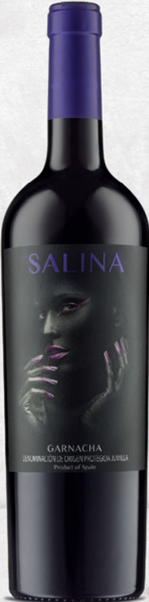
Garnacha alc. 13 % vol.