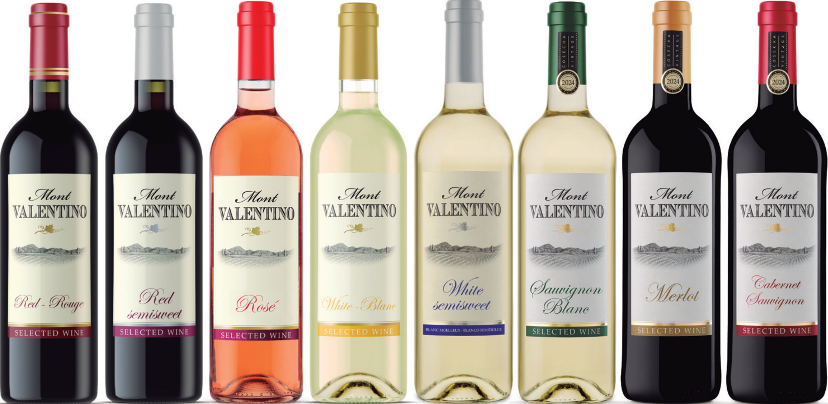
Vin rouge alc. 12 % vol.