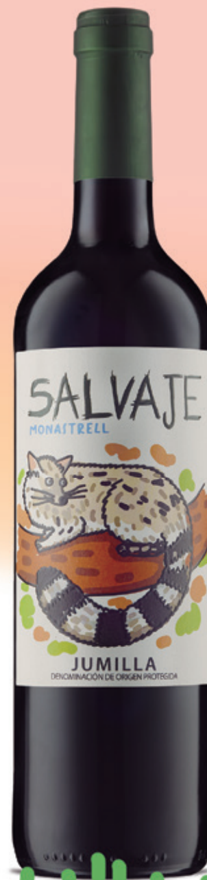
Monastrell alc. 13 % vol.