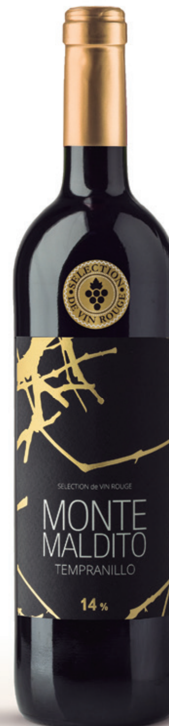
Tempranillo alc. 14 % vol.