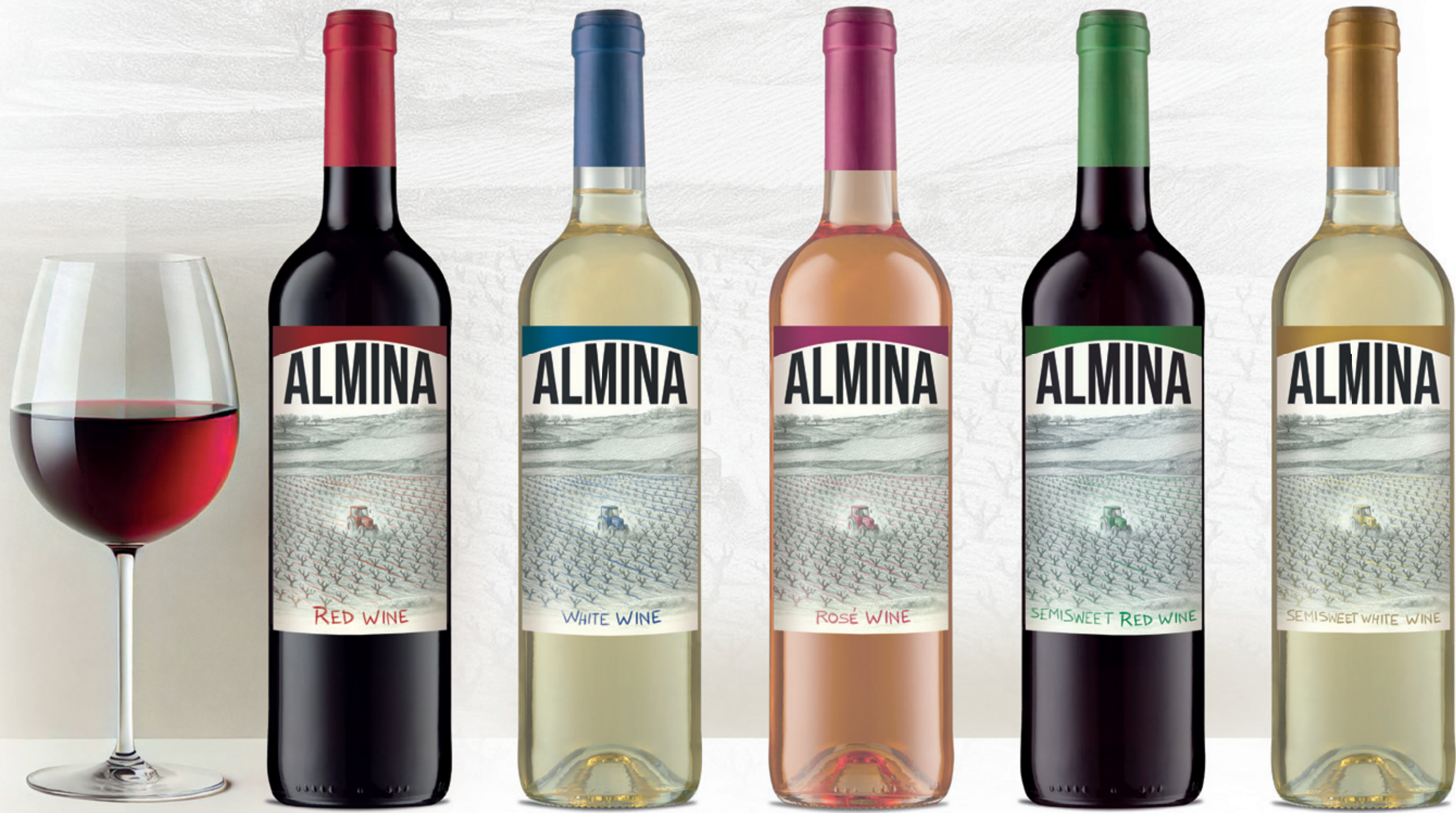
alc. 11 % vol.

Aujourd'hui, son vin porte son nom... et son silence.