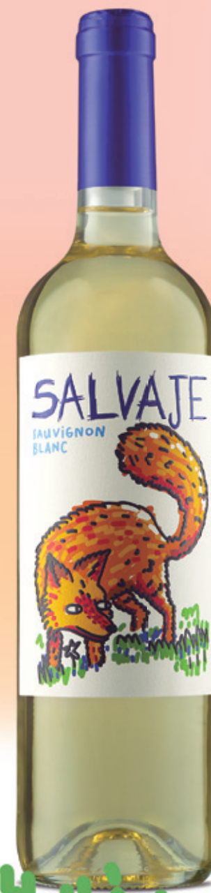
Sauvignon Blanc alc. 12 % vol.