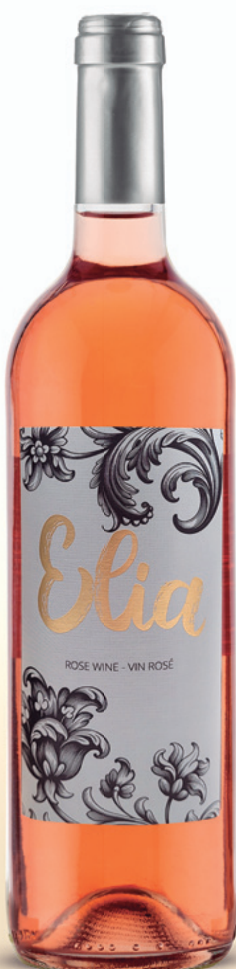
alc. 12 % vol.