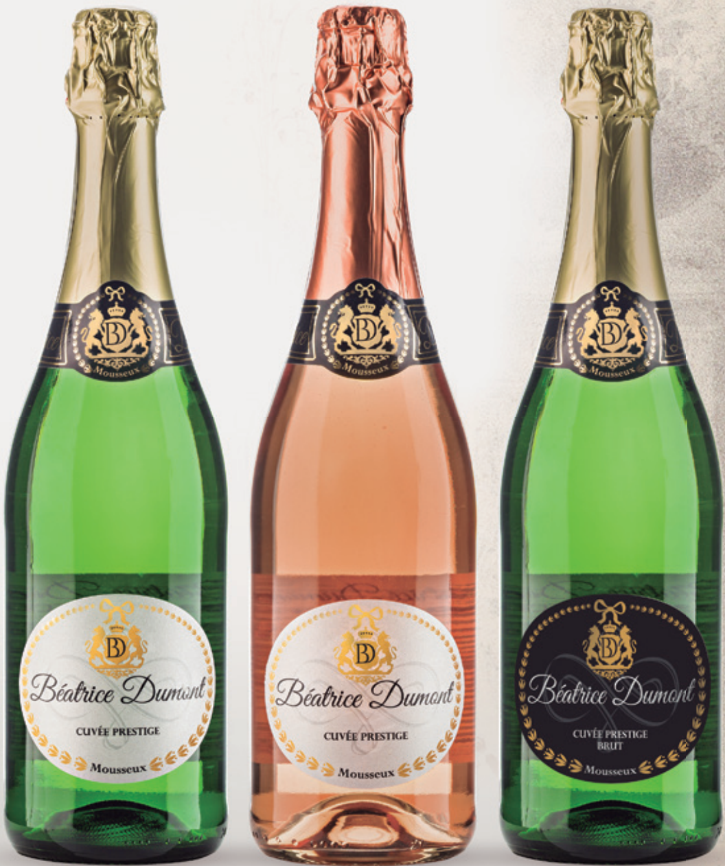
Vin mousseux demi-sec blanc alc. 10,5 % et 7 % vol.