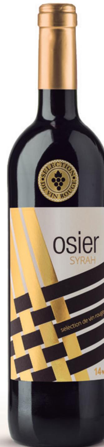
Syrah alc. 14 % vol.