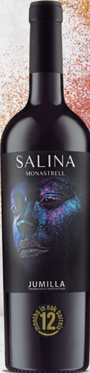
Chêne 12 mois Monastrell alc. 14 % vol.