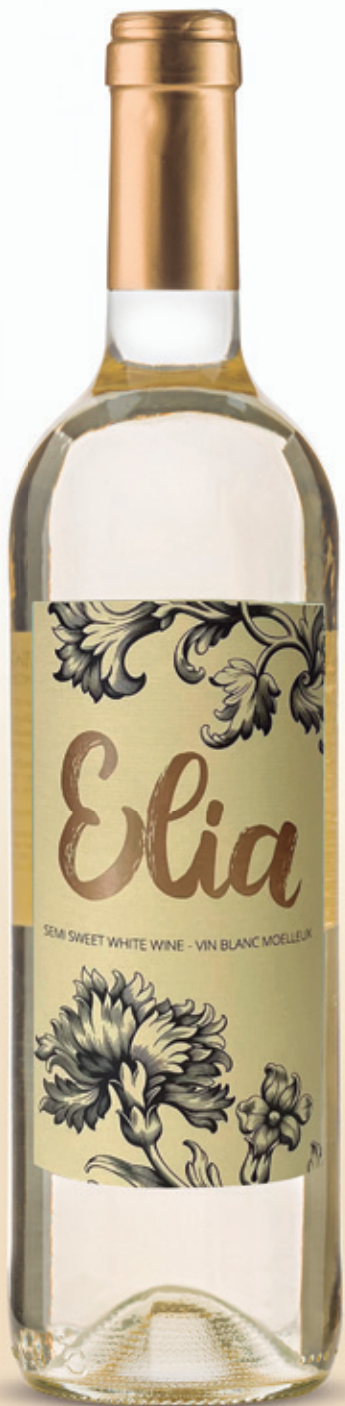
alc. 11 % vol.