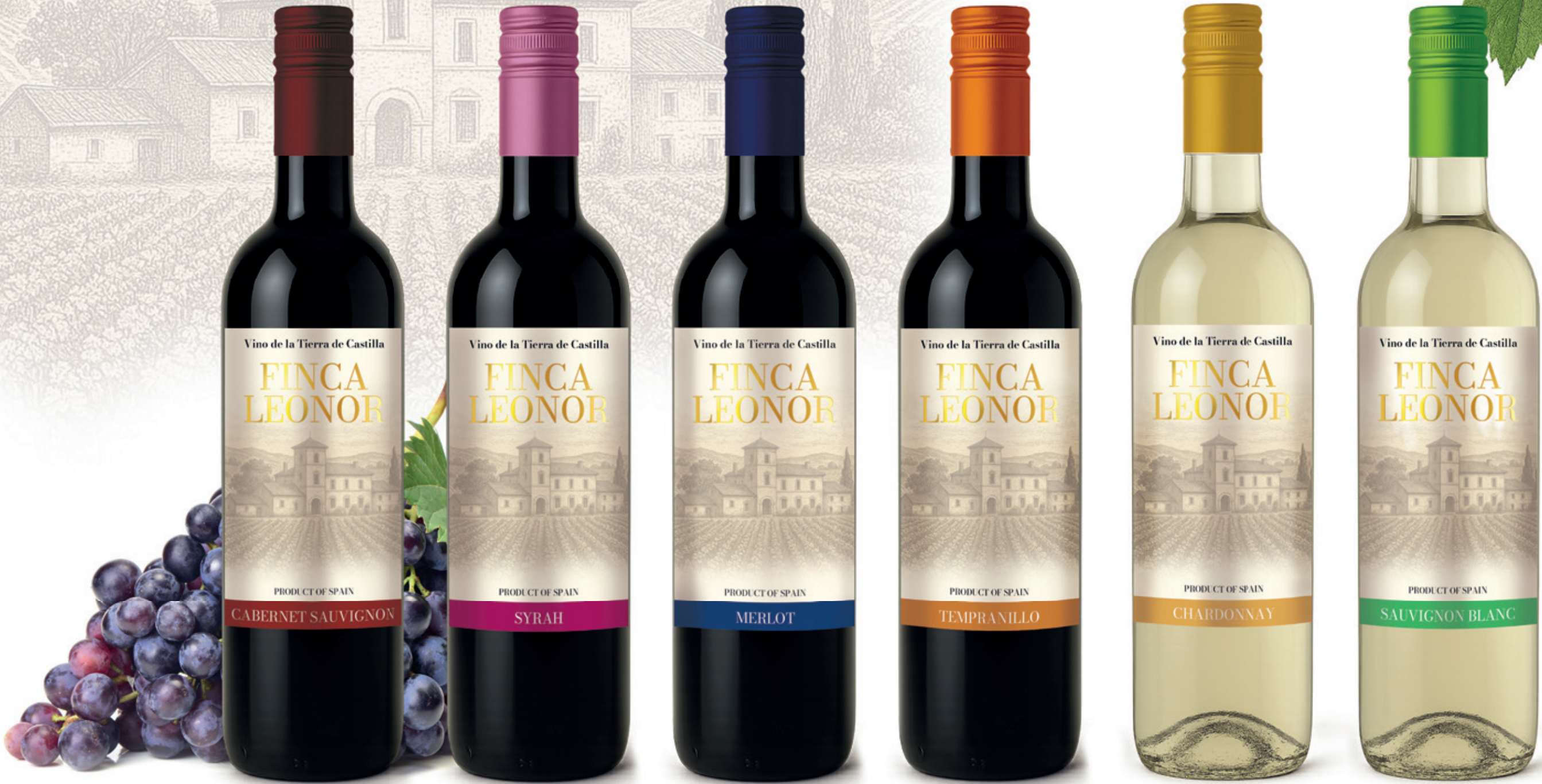
Cabernet Sauvignon alc. 12 % vol.