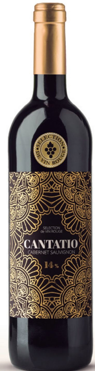
Cabernet Sauvignon alc. 14 % vol.