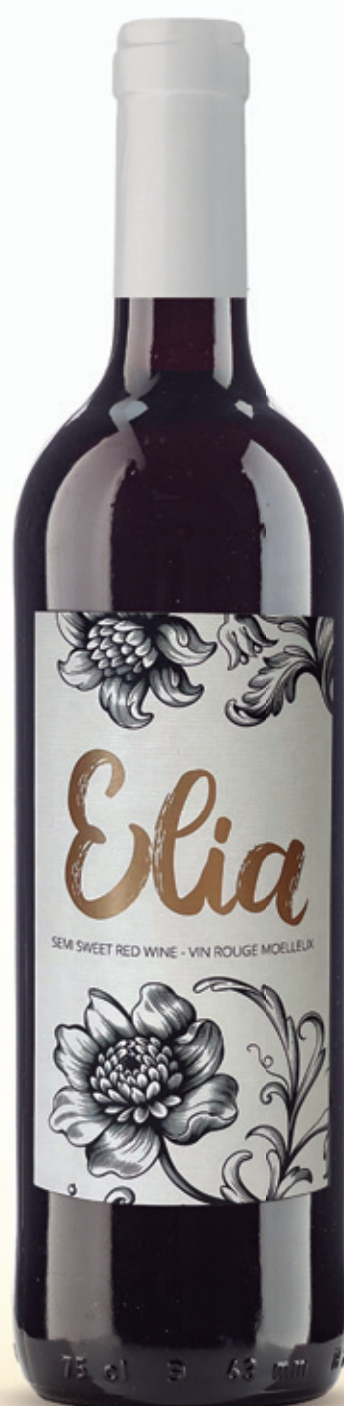
alc. 11 % vol.