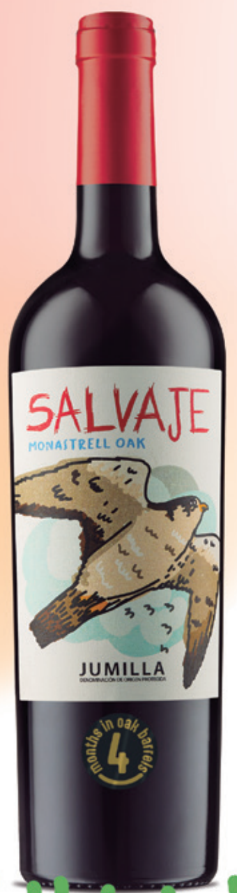
Chêne 4 mois Monastrell alc. 14 % vol.