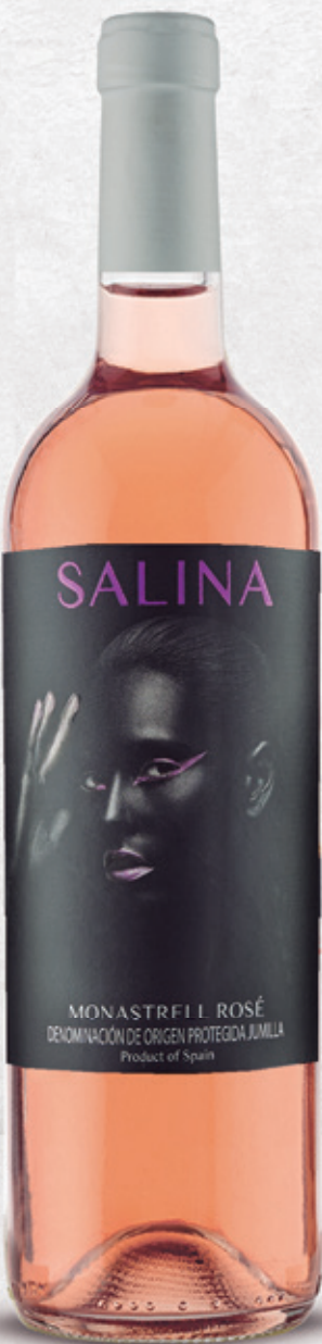
Monastrell rosé alc. 12,5 % vol.