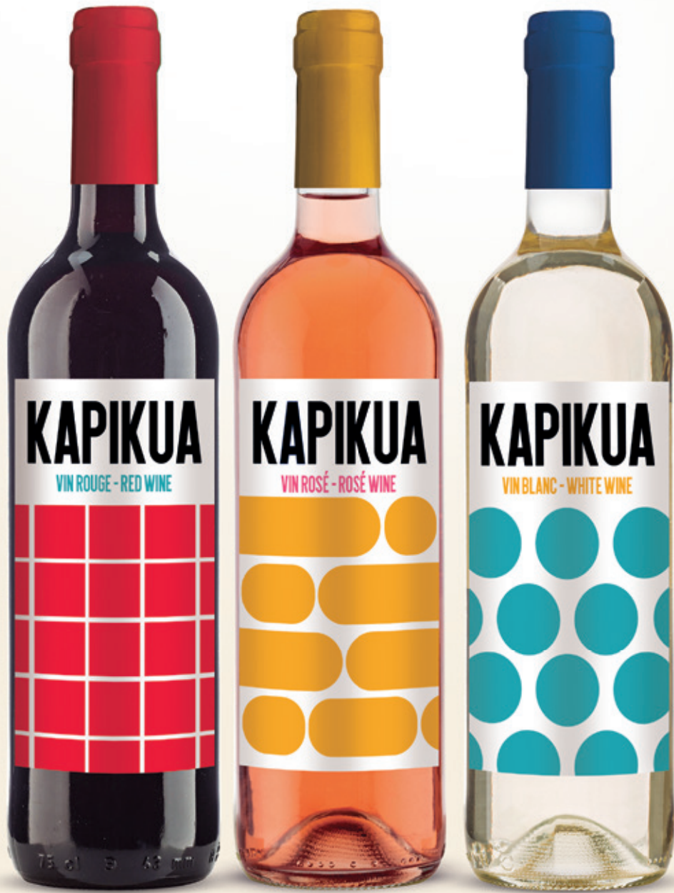
alc. 12,5 % vol.