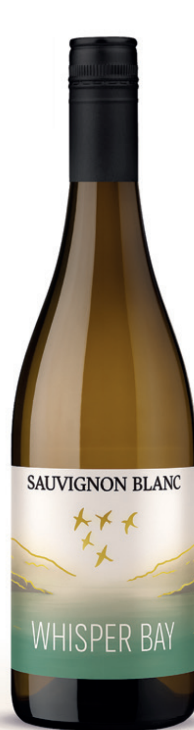
Sauvignon Blanc alc. 12 % vol.

Sauvignon Blanc se caractérise souvent par un profil herbacé, évoquant le poivron vert ou l'herbe fraîchement coupée.